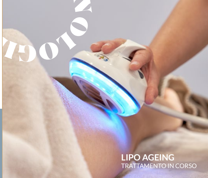
LIPO AGEING TRATTAMENTO IN CORSO

€ 100* (trattamento cosmetico corpo + apparecchiatura)