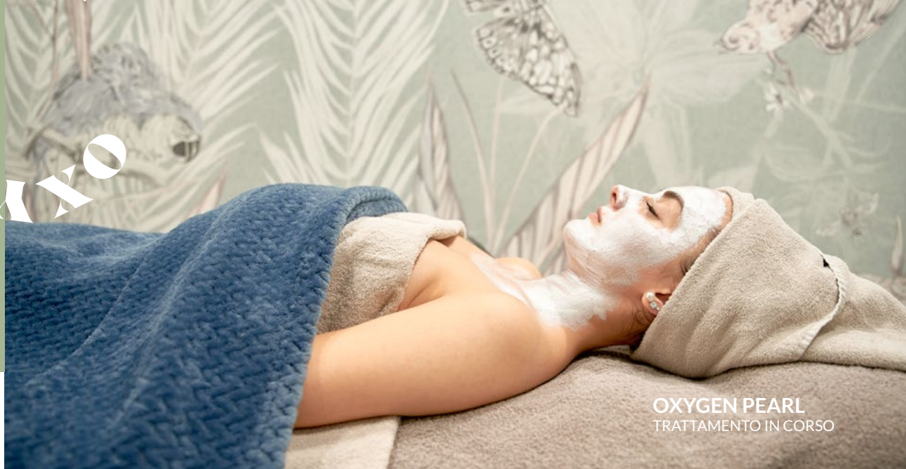
OXYGEN PEARL TRATTAMENTO IN CORSO