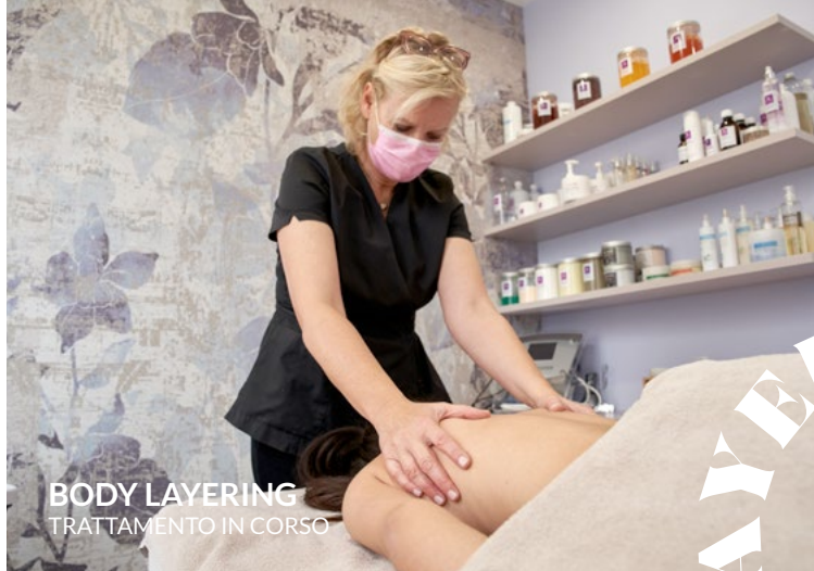
BODY LAYERING TRATTAMENTO IN CORSO