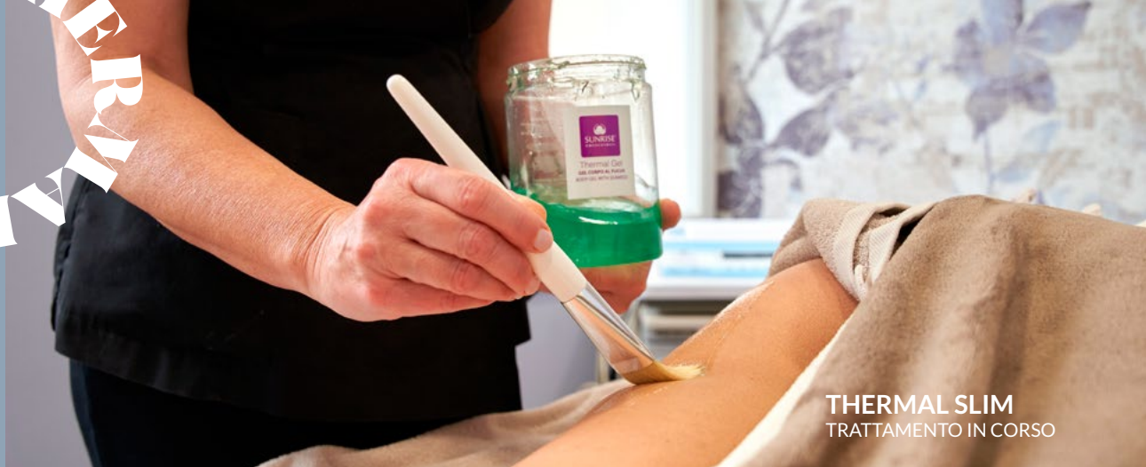
THERMAL SLIM TRATTAMENTO IN CORSO