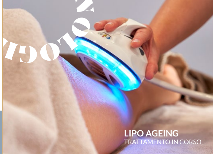
LIPO AGEING TRATTAMENTO IN CORSO

€ 120* (trattamento cosmetico corpo + apparecchiatura)